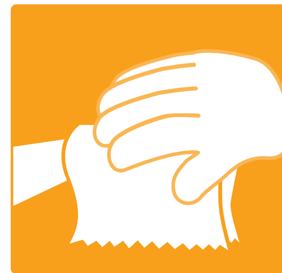
UBRUSOM ZATVORITE ČESMU