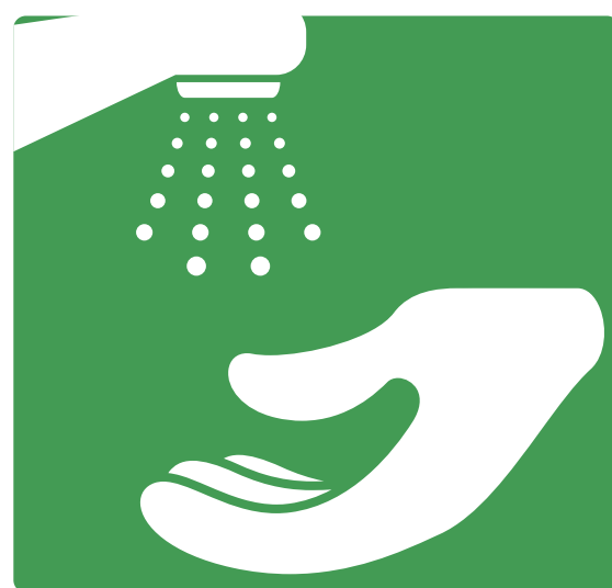
POKVASITE RUKU POD MLAZOM VODE