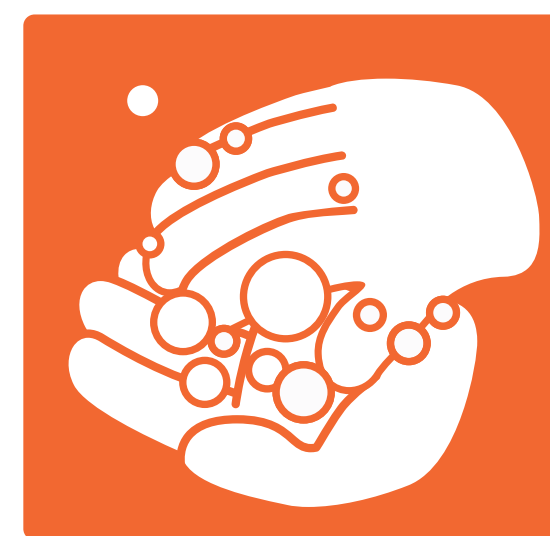
RUKOM O RUKU ISTRLJAJTE DLAN, NADLANICE, PALAC, PODRUČJE IZMEĐU PRSTIJU, VRHOVE PRSTIJU I PODRUČJE NOKTA