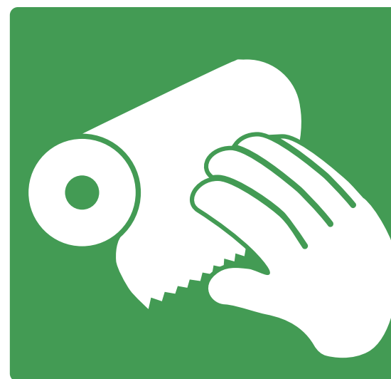
OSUŠITE RUKU PAPIRNATIM UBRUSOM