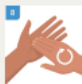
JOŠ JEDNOM TRILJAJTE VRHOVE PRSTIJU O DLAN DRUGE RUKU