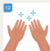
NAKON OVOGA VAŠE RUKU SU ČISTE