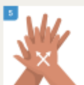
TRILJAJTE SA DONJE STRANE ŠAKE IZMEĐU PRSTIJU