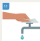
LOZITE NOVI UBRUS I NIKIN ZATVORITE ČESMU