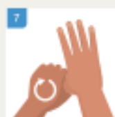
OPERITE SVAKI PRST POSEBNO