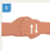
TRILJAJTE VRHOVE PRSTIJU ODJE ŠAKE