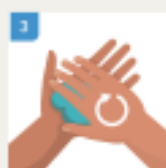
TRILJAJTE DLAN O DLAN